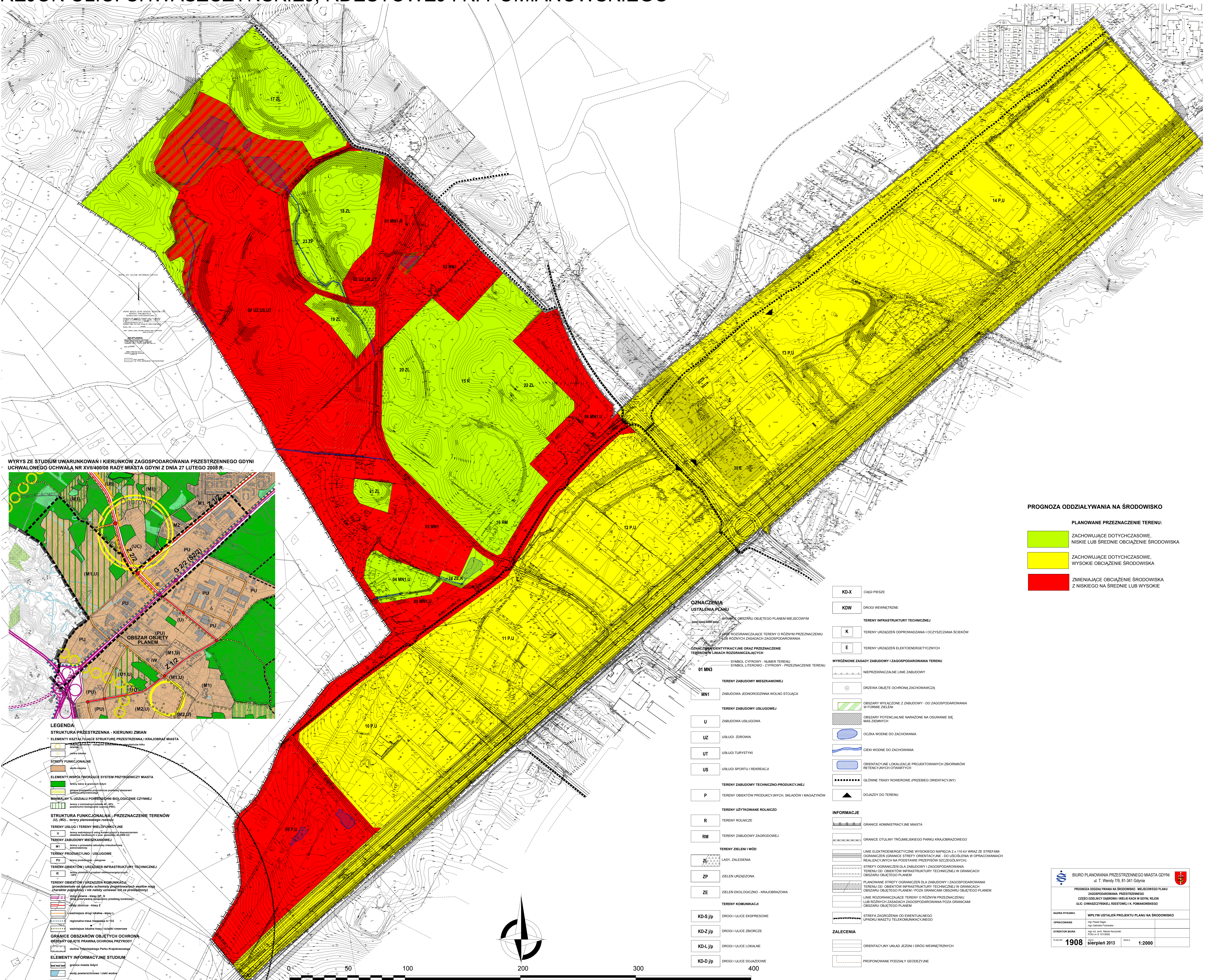
WYRYS ZE STUDIUM UWARUNKOWAŃ I KIERUNKÓW ZAGOSPODAROWANIA PRZESTRZENNEGO GDYNI UCHWALONEGO UCHWAŁĄ NR XVII/400/08 RADY MIASTA GDYNI Z DNIA 27 LUTEGO 2008 R.